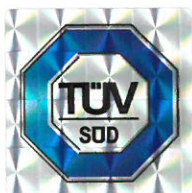
Vedúci certifikačného orgánu